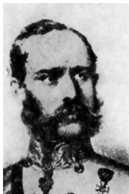
Rakouský císař František Josef I.

Rakouská armáda si připravila pozice na Probluzské výšině a přesto asi po 4 hodinách boje byla přinucena k ústupu směrem na Břízský les a výšinu ovládli Prusové.