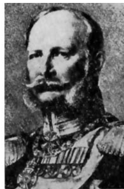
Pruský král Vilém I.