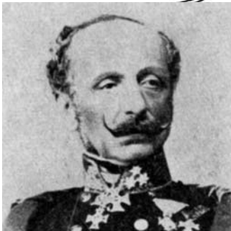
Vrchní velitel rakovské armády polní zbrojmistr Ludvík August Benedek