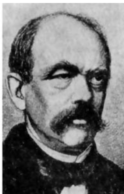
Předseda pruské vlády Otto von Bismarck