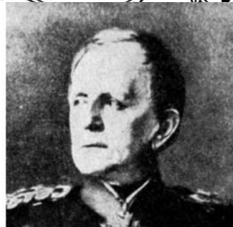
Náčelník pruského generálního štábu generál Helmuth Karel von Moltke